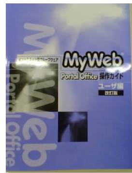
利用者様用テキスト 「MyWeb Portal Office 操作ガイド ユーザ編」 (改訂版)